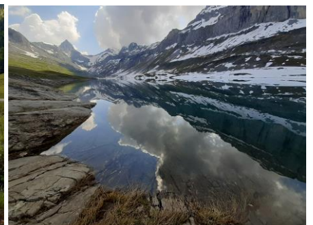
Glattalpsee (Mai 23)